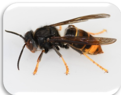
Asiatische Hornisse

schwarze Grundfärbung breiter orangener Streifen am Hinterleib und feine gelbe Binde am ersten Segment Kopfvorderseite orange gelbe Beinenden nicht nachtaktive