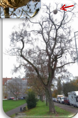
Filialnest der Asiatischen Hornisse Foto 1: D. Heuclin Foto 2: K. Grabow