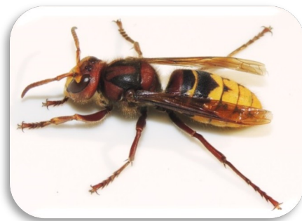
Europäische Hornisse

blässgelber Hinterleib mit schwarzen Streifen Kopfvorderseite gelb Kopfoberseite rot Brust und Beine schwarz und rotbraun auch nachts flugaktiv