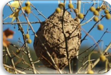
Nest der Asiatischen Hornisse