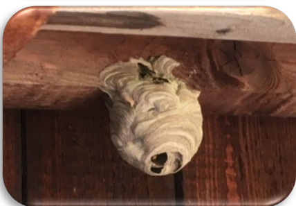
Gründungsnest der Asiatischen Hornisse Foto 1: H. Wiedemann Foto 2: H. Braunwart