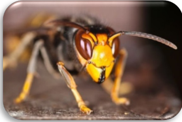
Asiatische Hornisse