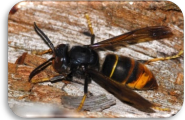
Asiatische Hornisse

– ein neuer Bienenschädling bedroht die Bienenvölker –