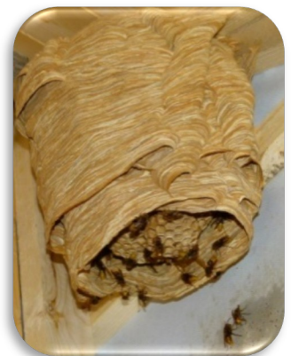
Nest der Europäischen Hornisse

Nistplätze meist geschützt in Hohlräumen wie Nistkästen, Dachböden, Baumhöhlen Nestboden offen, als Flugloch genutzt Nestgröße Ende Sommer 30 – 60 cm 400 – 700 Tiere